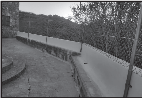
Iċ-ċint imkaħħal, kanen u grada ġdida

F'dawn l-aħħar xhur u ġimghat sar diversi xogħol ta' manutenzjoni fil-Girgenti. Il-konkos fuq iċ-ċint tan-naħa ta' isfel kien spicċa u l-grada kienet saddet. It-travi li hemm fit-triq ukoll kienu sewsu. Wara kważi tletin sena kien wasal iż-żmien li jinbidlu biex mhux biss jagħtu dehra isbaħ lil post imma wkoll biex joffru protezzjoni u sigurtà għal min jitla l-Girgenti.