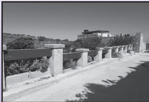
It-travi kollha ġew mibdula u miżbugħa